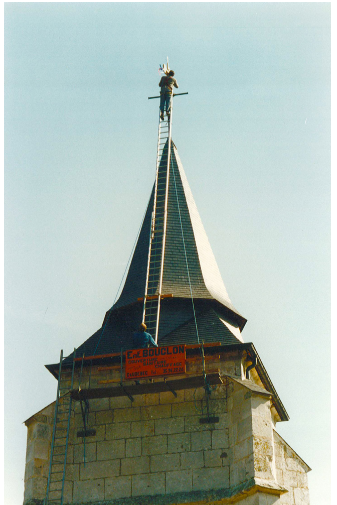
Inauguration de la campagne de restauration de 1990