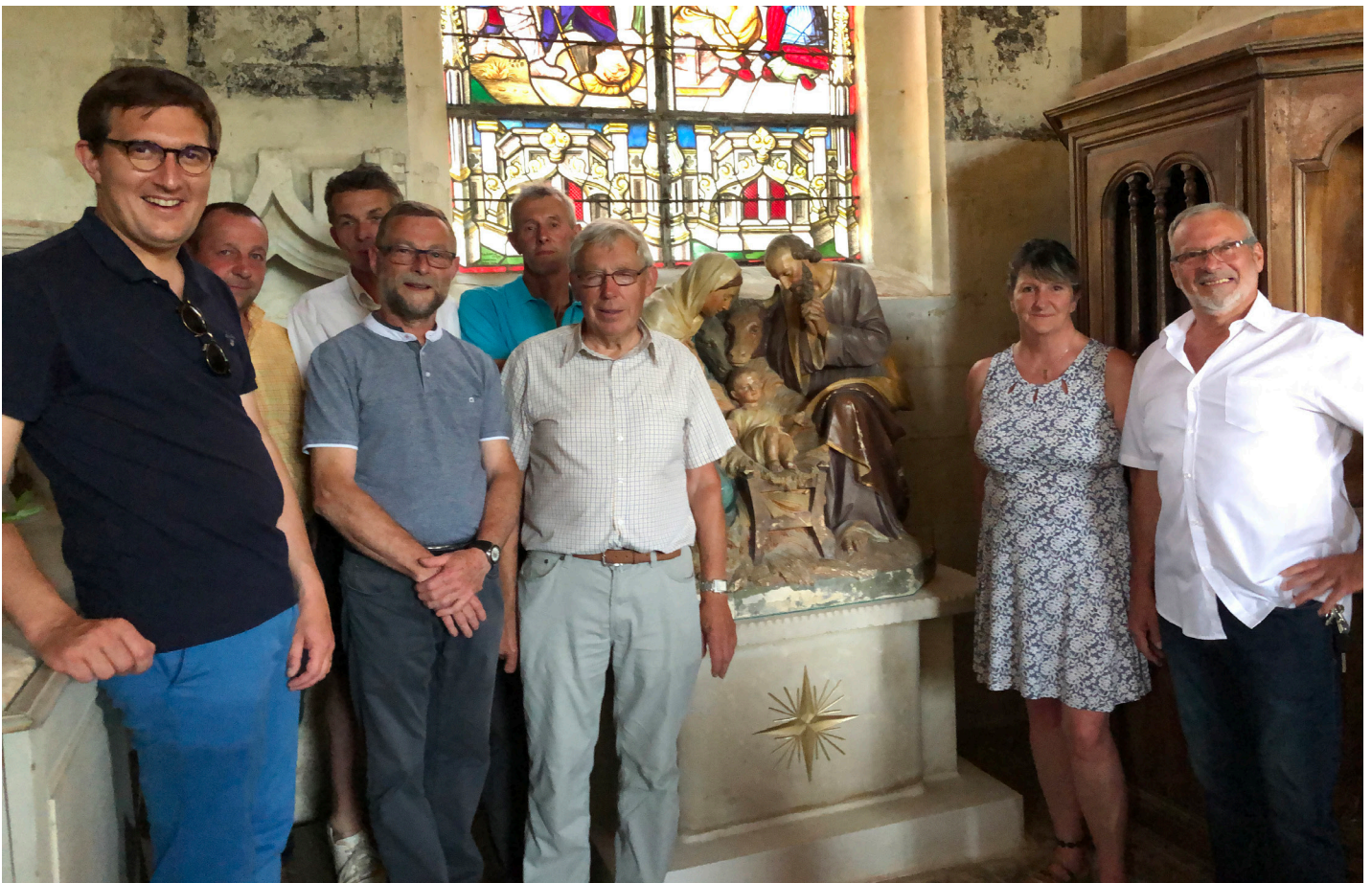
Restauration de l'autel de la chapelle en 2019