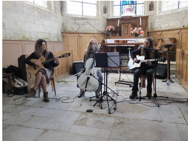
Les Goûters Musicaux de Bébéc