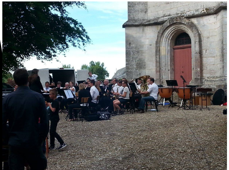
Soirées champêtres de la Saint Jean