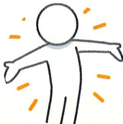
Recrutement en cours