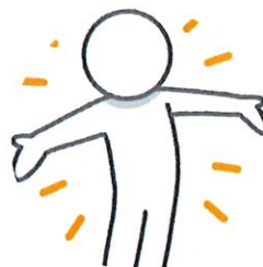
Recrutement en cours